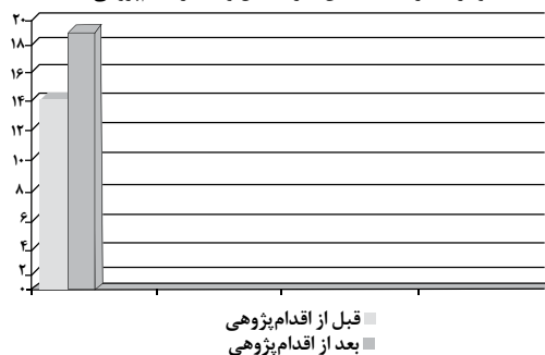
نمودار شماره ۲: میانگین نمرات قبل و بعد از اقدام پژوهی

تحلیل: همچنان که جدول شماره ۱ نشان می دهد، میانگین نمرات دانش آموزان قبل از اقدام ۱۴/۶۸ بود و بعد از اقدام به ۱۹/۵۰ افزایش یافت. برای تعیین معناداری از آزمون t استفاده گردید.